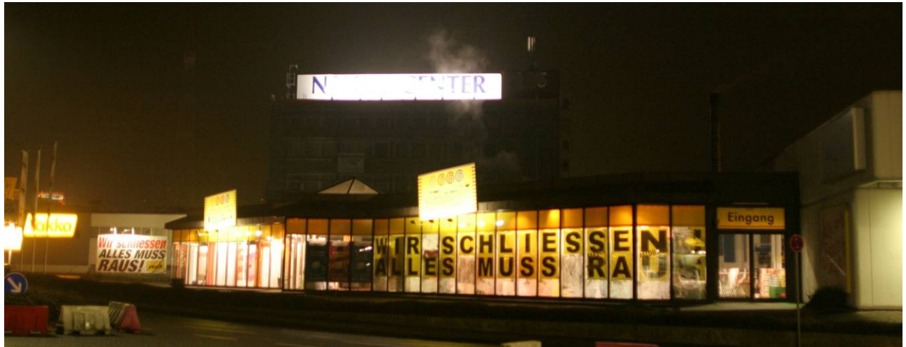
Bild 11: Mitten in der Nacht sind solche Lichtorgien entlang menschenleeren Strassen reine Energieverschwendung

Nur die wenigsten Beleuchtungen müssen notwendigerweise während der ganzen Nacht in Betrieb sein. Werbung und Fassaden sollten während der Nachtruhe (analog dem Nachtzeitraum im Lärmschutz), zwischen 22 Uhr und 06 Uhr nicht beleuchtet werden. Arealbeleuchtungen können mit Anwesenheitssensoren zielgerichtet aktiviert werden und erfüllen die damit beabsichtigte Schutz- und Sicherheitsfunktion sogar besser als im Dauerbetrieb.