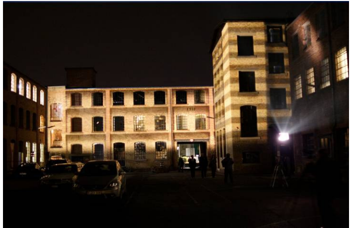
Bild 1: Mit Maskentechnik ist eine exakte Gebäudeanstrahlung möglich

Im privaten Bereich kann grundsätzlich auf Beleuchtung zu Werbezwecken verzichtet werden. So ist die Anstrahlung von privaten Gebäuden kaum sinnvoll; wenn doch, dann nur mit Maskentechnik (Bild 1). Aber auch der Einsatz von Leuchten für kommerzielle Zwecke ist immer auf ein vertretbares Minimum zu begrenzen. Der Einsatz von Skybeamern ist immer zu hinterfragen, vor allem bei längerer Einsatzdauer.