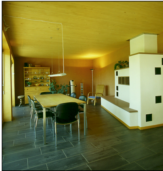
Gesund und schön wohnen mit naturnahen Materialien

Sobald Sie sich mit gesunden und problematischen Baumaterialien näher befassen, werden Sie entdecken, dass sich diese Auseinandersetzung für Sie selber, aber auch für die Umwelt lohnt.