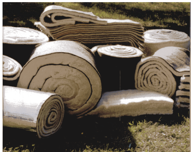
Flachs, Schaf und Späne: Die Auswahl an Dämmstoffen aus Naturmaterialien ist gross