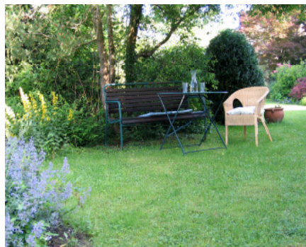
Eine lauschige Ecke macht jeden Garten einzigartig.