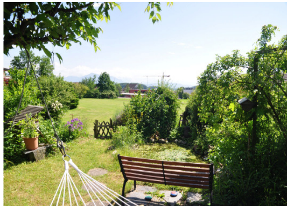
Auch ein kleiner Garten kann zur Naturoase werden.

Sind Sie interessiert, aber noch nicht ganz überzeugt? Dann blättern Sie doch einmal in einem der unten aufgeführten Bücher – ein Teil davon ist in der Gemeindebibliothek erhältlich. Finden Sie diese grünen Oasen nicht auch verführerisch? Neben praktischen Tipps werden Sie dabei auch die einheimische Flora und Fauna besser kennen und beobachten lernen. Machen Sie danach ein paar neugierige Spaziergänge durch Mettmenstetten. Sie werden rasch entdecken, dass in unserem Dorf – wie die Fotos zeigen – schon zahlreiche naturnahe Gärten bestehen, deren Besitzerinnen und Besitzer stolz und zufrieden sind – und Ihnen auf Anfrage sicher auch einen Einblick in ihr Naturparadies gewähren.