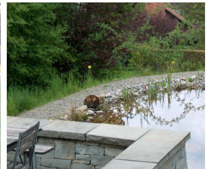
Wasser bereichert den Garten mit Leben