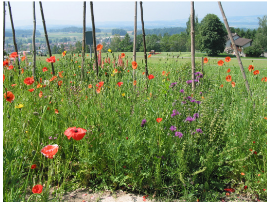
Farbenfroh wie ein Bild von Monet

Verbünden Sie sich mit der Natur! Sie wird es Ihnen hundertfach danken.